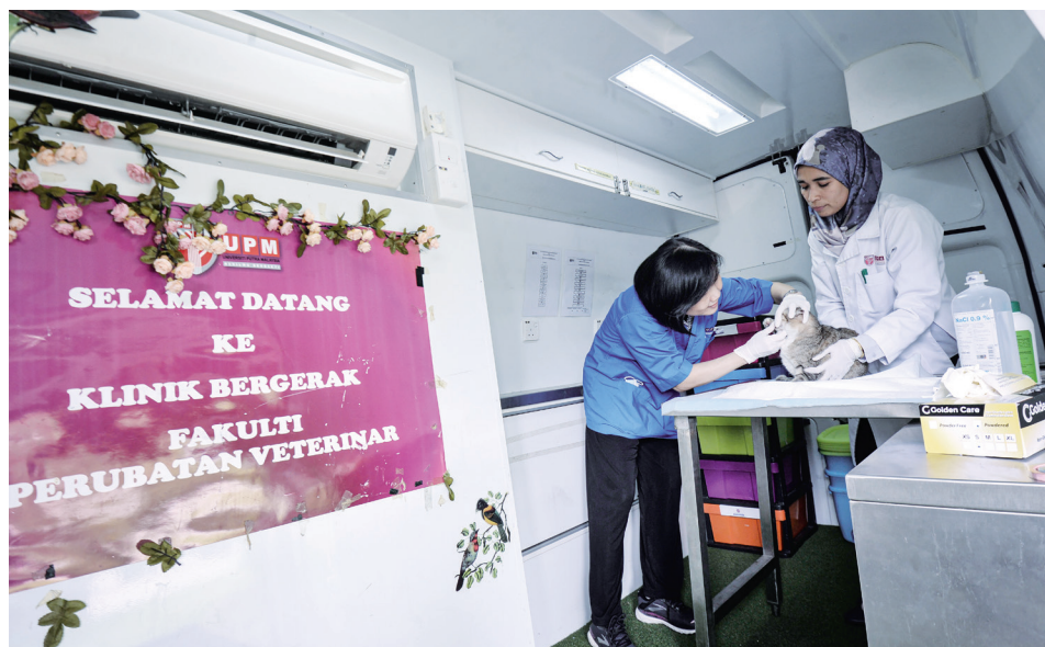
RAWATAN asas seperti pemeriksaan, vaksin dan pemberian ubat cacing merupakan antara perkhidmatan yang ditawarkan klinik bergerak ini.