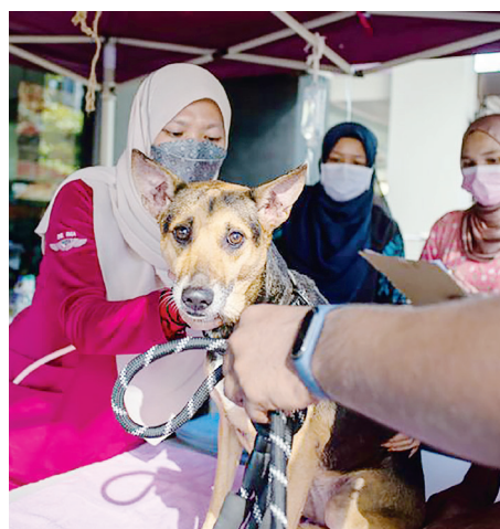
KLINIK bergerak ini sedia merawat semua jenis haiwan yang memerlukan.