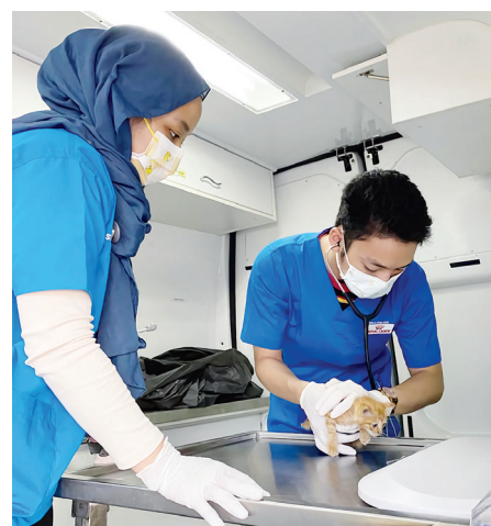
KLINIK ini bergerak secara berkala demi memberikan khidmat terbaik.